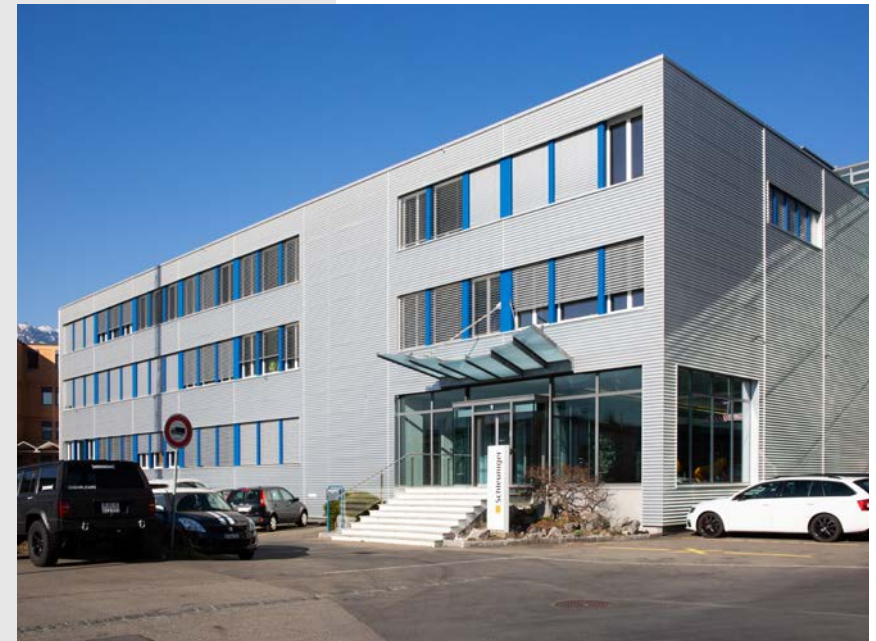
Der Schleuniger-Hauptsitz in Thun.

grosses Marktpotenzial verspricht. Auch die Trends Automatisierung, Digitalisierung, autonomes Fahren und Elektromobilität bieten Wachstumsmöglichkeiten. Diese Begrifflichkeiten sind nicht bloss leere Schlagwörter. Dahinter stehen mögliche Wachstumstreiber, die jedoch geprüft und gegebenenfalls in eine Gesamtstrategie eingebunden sowie dann ins Operative überführt werden müssen. Schleuniger hat sich im Jahr 2017 frühzeitig mit diesen Themen auseinandergesetzt. Damals entschied sich das produzierende Unternehmen als eines der ersten für die Umstellung von SAP ECC auf SAP S/4HANA.